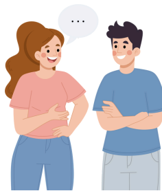
DES PERMANCES DANS LES COMMUNES SUR DEMANDE POUR UN REPÉRAGE CIBLÉ PAR TERRITOIRE