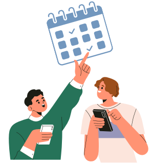
UNE PARTICIPATION AUX TEMPS FORTS LOCAUX POUR IDENTIFIER LES JEUNES