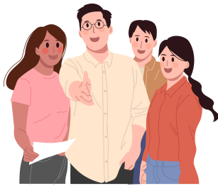
UNE ÉQUIPE DEDIEE AUX JEUNES DE RÉFLEX