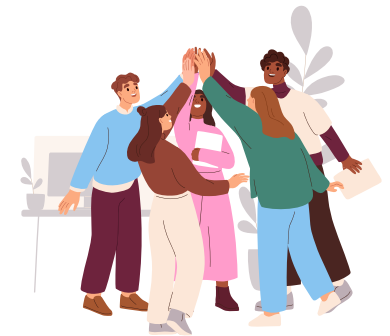
DES ATELIERS AUX THÉMATIQUES VARIÉES POUR REMOBLISER LES JEUNES, LEVER LES FREINS A LA FORMATION OU L'EMPLOI