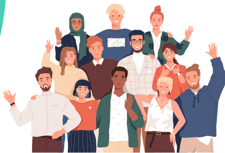
DES ÉVÈNEMENTS POUR MOBILISER LES HABITANTS