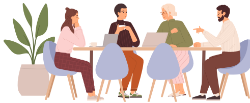
DES RENCONTRES AVEC LES PARTENAIRES POUR INFORMER DE L'ACTION